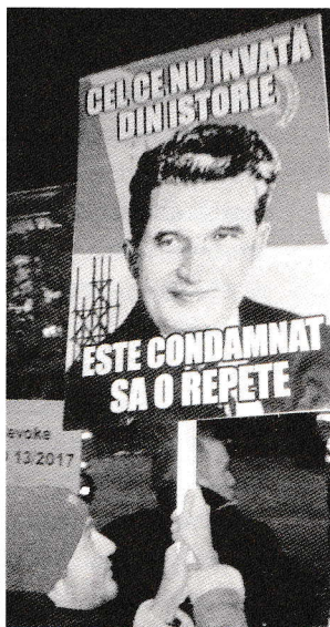
Secvență din manifestațiile #rezist din Piața Victoriei din București, februarie 2017.